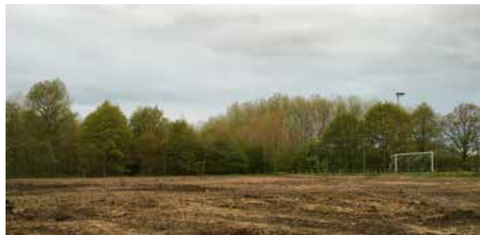
▲ De illegaal ontboste zone vertraagt het jeugdproject.

De burgemeester wilde twee voetbalveldjes voor KFC Volharding Wintam-Eikevliet creëren door een aantal bomen te kappen in een Natura2000-gebied. Onbegrijpelijk gebeurde dat zonder ruimtelijk uitvoeringsplan of toelating om te ontbossen. Illegaal dus. Deze actie hypothekeert en vertraagt het ganse jeugdproject.