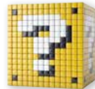
Welke N-VA-topper komt naar Bornem? p.3