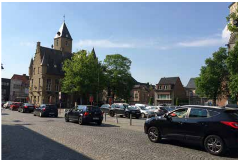
▲ Het is dagelijks aanschuiven op het Cardijnplein en in de Boomstraat.

Mobiliteit was bij de vorige gemeenteraadsverkiezingen een hot item. Drie jaar later is er nog steeds geen toekomstgericht mobiliteitsplan. Het gemeentebestuur werkt daar nochtans zagezegd al sinds 2013 aan. Maar pas in april dit jaar besliste het college om externe partners en experts aan te stellen. Het lijkt er met andere woorden op dat er tot op dat moment – ondanks de vele N-VA-vragen, -ideeën en -opmerkingen in de gemeenteraden – weinig gebeurd is in het dossier. De uitdagingen zijn nochtans groot.