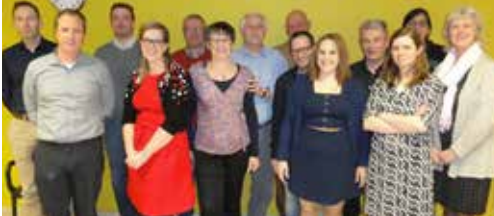
Nieuw bestuur voor N-VA Bornem. p.2