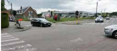
Nieuw kruispunt Lodderstraat volstaat niet p. 2