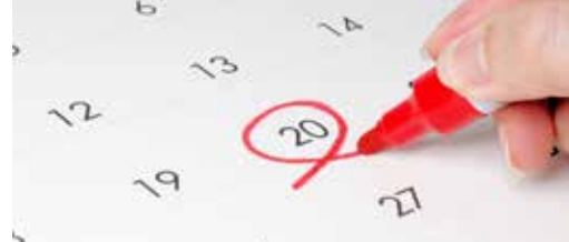
Noteer nu al in uw agenda p. 3